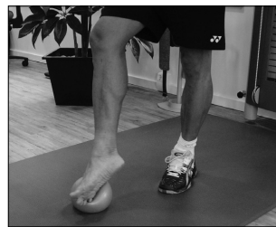
Mobilisation des Sprunggelenks