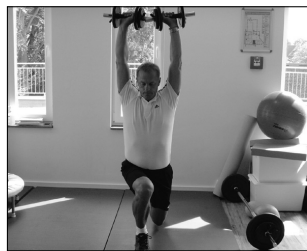
Einbeinkniebeuge mit Rumpfstabilisation