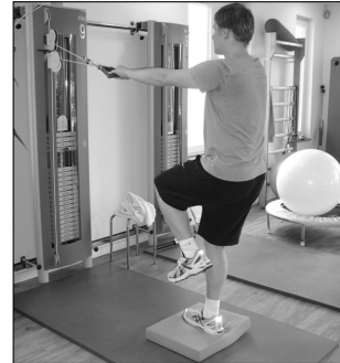
Einbeinstand auf AIREX Balance-Pad