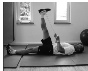
Dehnen der Oberschenkelrückseite und Wade