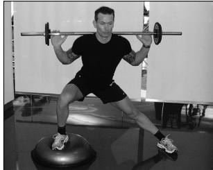
Ausfallschritt seitlich auf Bosu-Ball