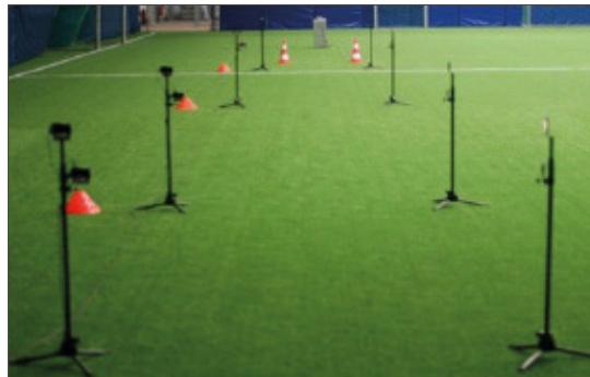
Abb. 39 Aufbau der Lichtschranken in einer Kunstrasenhalle (eigene Darstellung)

Es werden insgesamt drei Läufe von jedem Probanden aufgezeichnet. Die beiden besten Läufe werden gemittelt.