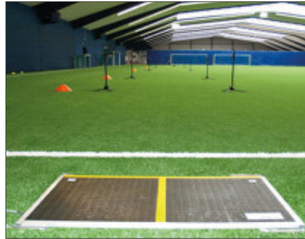
Abb. 38 Startplatte zur exakten Messung der zyklischen Schnelligkeit mit Zwischenzeiten in einer Halle mit Kunstrasenbelag (eigene Darstellung)